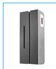
Lector de Tarjeta y Lector de Huella