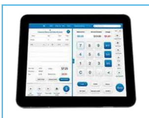
Monitor LCD 9.6"